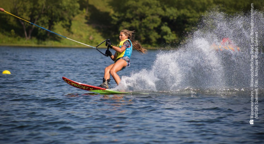
Wasserwahnsinn. – Woiwodschaftliches Sport- und Rekreationszentrum (WOSiR) Szelment.

Städtisches Kultur-, Sport- und Rekreationszentrum ul. 1 Maja 19, 17-250 Kleszczce Tel. +48 85 6818054 E-Mail: moksirkleszczce@gmail.com