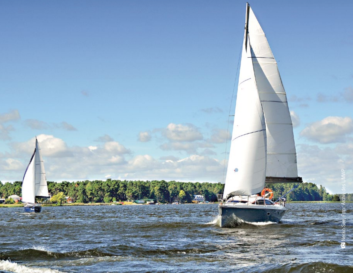
© Necko See. Foto: Archiv des UMMP

Die zahlreichen Seen von Podlaskie sind nicht nur eine Landschaftszierde, sondern bieten auch viele Möglichkeiten zur aktiven Erholung am Wasser. Neben Boots- und Katamaranfahrten können Touristen hier das einzigartige Angebot nutzen und runde Segelboote ausleihen oder an der Internationalen Regatta der Rundboote auf dem Pomorze See teilnehmen. Die touristische Infrastruktur in der Gegend der Seen besteht aus modernen Wassersportgeräteverleihen und Erholungszentren, die eine Übernachtung an den ungewöhnlichsten Orten ermöglichen, z. B. in den runden Häusern des polenweit einzigen „Torfdorfes“. Touristenattraktionen am Augustów-Kanal sind die unterschiedlichen Boots- und Schiffstypen, darunter hölzerne Gondeln sowie das Passagierschiff „Jaćwież“, welches ein stilisiertes Jatwinger-Boot darstellt.