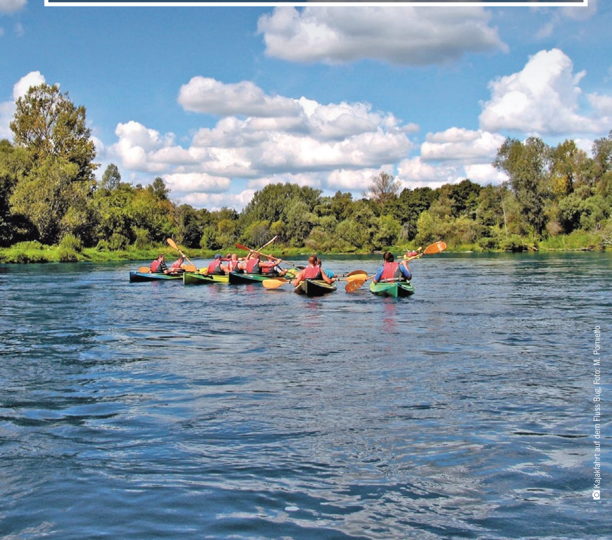
Kajakfahrt auf dem Fluss Bug

Der Naturreichtum der Flüsse von Podlaskie lässt sich am besten aus der Nähe kennenlernen, z. B. vom Kajak aus. An der Biebrza kann man zu einer Floßfahrt aufbrechen oder sich am Narew von traditionellen Kähnen überraschen lassen. Das Aushängeschild der Biebrza sind ihre ausgedehnten Sumpf- und Moorflächen, die zahlreichen, hier nistenden Vogelarten sowie der König dieser Gebiete: der Elch. Der mäandrierende Narew besitzt ein stark verzweigtes Flussbett, ist von Sumpfflächen umgeben und wird „polnischer Amazonas“ genannt. Der Bug hingegen führt in den malerischen und kulturell interessanten Süden der Region.