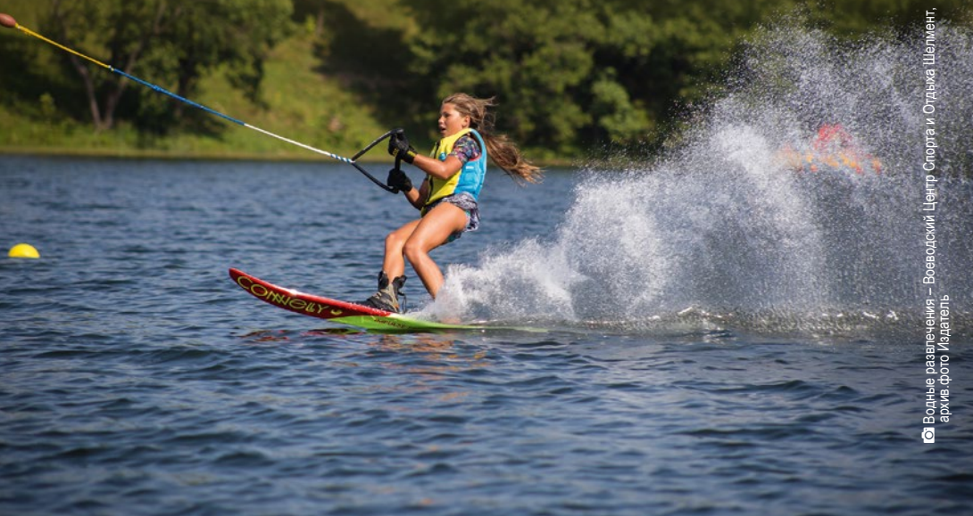
Водные развлечения – Воеводский Центр Спорта и Отдыха Шелмент

Городской Центр Культуры, Спорта и Отдыха, Клещеле, ул. 1 Мая 19 (Zalew Repczyce, Miejski Ośrodek Kultury, Sportu i Rekreacji, ul. 1 Maja 19, 17-250 Kleszczele) Телефон: +48 85 6818054 e-mail: moksirkleszczele@gmail.com