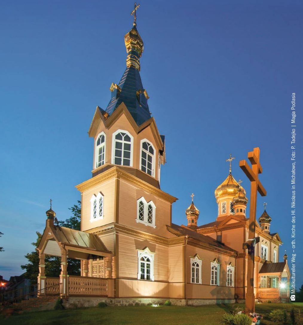
☒ Multikultureller Weg – orth. Kirche des Hl. Nikolaus in Michalowo, Foto: P. Tadejko | Magia Podlasia

Auf die heutige Woiwodschaft Podlaskie blickend, fällt es leicht die Spuren vieler Kulturen zu bemerken. Sie sind in der Architektur, im Dialekt und sogar in der Küche der Region wahrnehmbar. Die Einflüsse verschiedener Nationalitäten sorgen dafür, dass diese Region oft als Tiegel der vielen Kulturen bezeichnet wird.