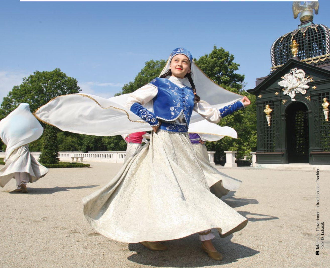
© Tatarische Tänzerinnen in traditionellen Trachten. Foto: D. Lukasiak

Die hiesige Offenheit für andere Kulturen gibt der gemeinsame Spaß während der regionalen Feste am besten wieder. Musik, Tanz und Küchenspezialitäten verschiedener Nationalitäten sind Schlüsselemente bei einem Großteil der Feste. Ausstellungen, Workshops und Stände mit volkstümlicher Handwerkskunst und traditionellen Regionalprodukten begleiten diese Veranstaltungen. Gemeinsamer Gesang und eine allgegenwärtige Freude verbinden die Teilnehmer der Festivals und Jahrmärkte von Podlaskie.