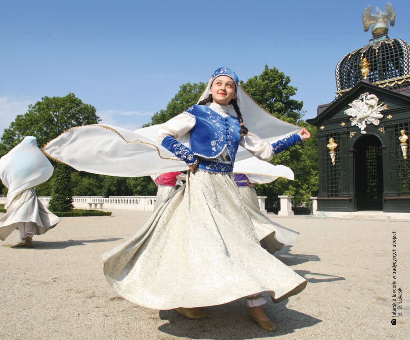
📷 Tatarskie tańcerki w tradycyjnych strojach

Podlaską otwartość na inne kultury najlepiej oddaje wspólna zabawa podczas festynów regionalnych. Muzyka, tańce i specjały kuchni różnych narodowości to kluczowe elementy większości takich imprez. Spotkaniom towarzyszą także wystawy, warsztaty oraz stoiska z rękodziełem ludowym i tradycyjnymi produktami regionalnymi. Wspólny śpiew i wszechobecna radość łączą wszystkich uczestników podlaskich festiwali i jarmarków.