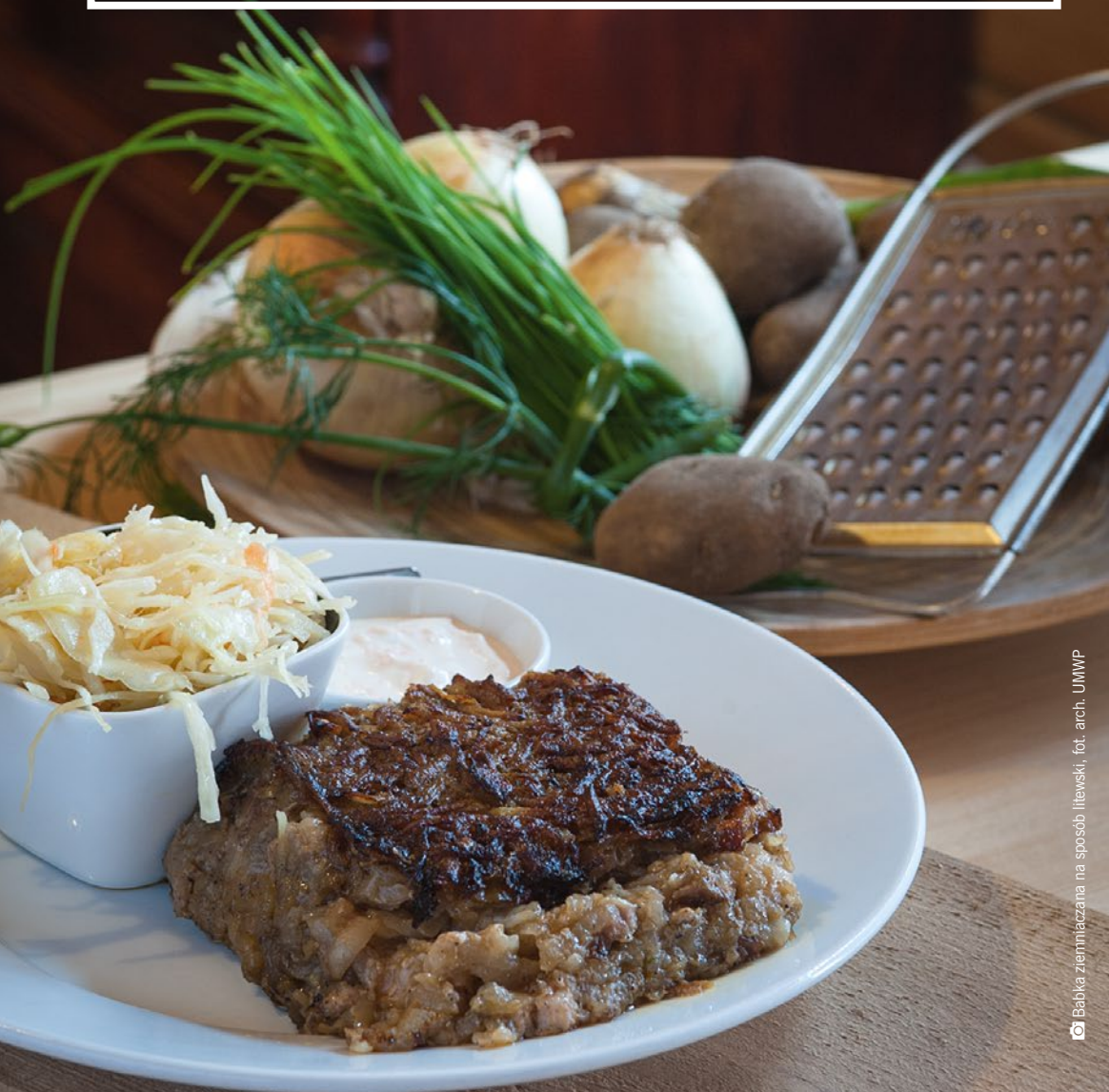
Babka ziemniaczana na sposób litewski

Województwo podlaskie to mozaika narodowości i kultur, które na przestrzeni dziejów oddziaływały na kształtowanie się i rozwój regionu. Do życia codziennego tutejszych mieszkańców przenikały wpływy białoruskie, litewskie, tatarskie i żydowskie. Dziś odzwierciedlają je bogactwo architektury, muzyka, zwyczaje, gwara i kulinaria. Spróbuj, czym są buza, pierekaczewnik lub kartacze i daj się ponieść nutom melodyjnej muzyki tradycyjnej Podlasia.