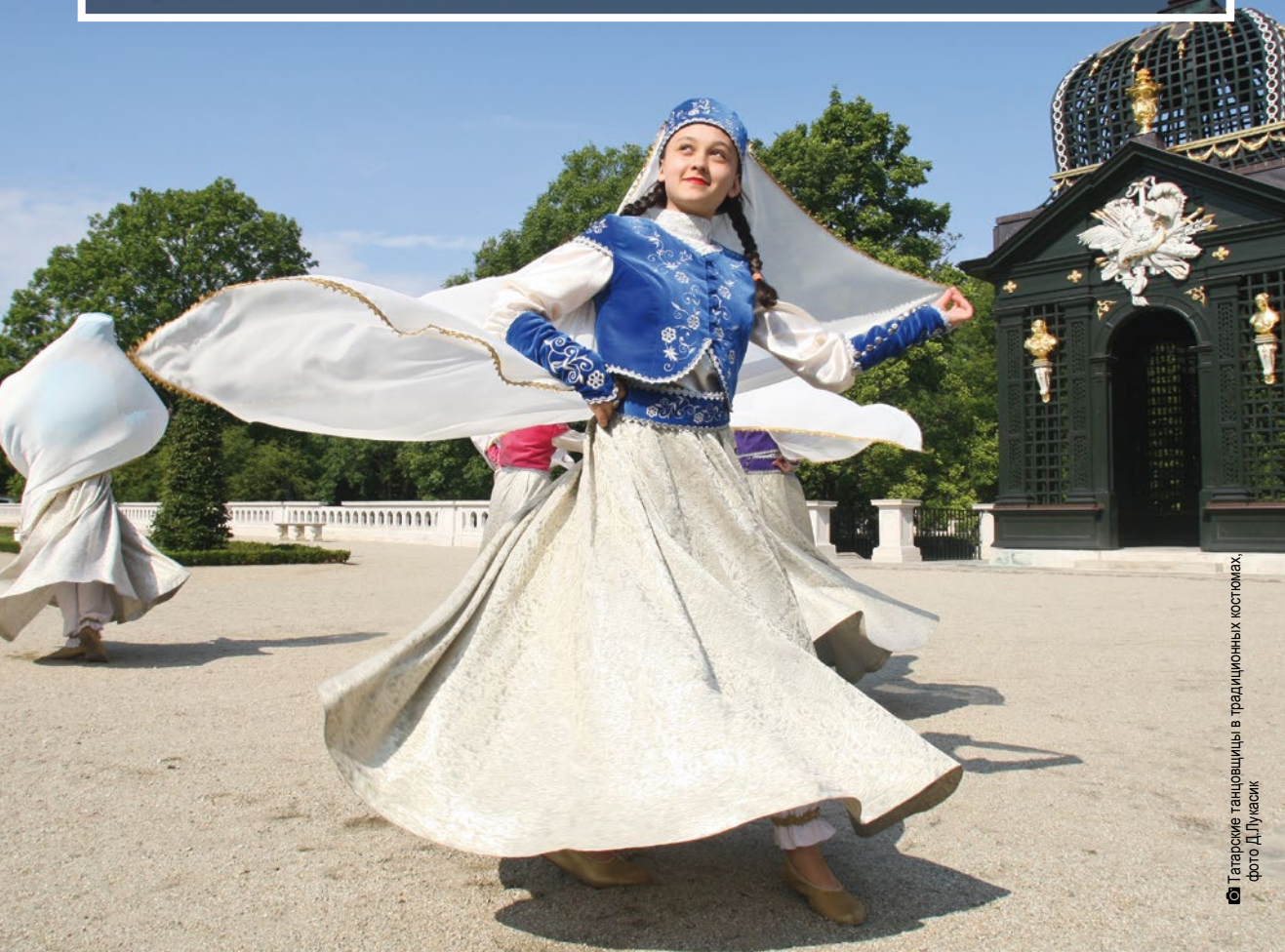
Татарские танцовщицы в традиционных костюмах

становятся разноцветной сценой, на которой звучат мелодии разных народов, жителей подляского воеводства а также самых отдалённых районов мира. Люди танцуют, учатся играть на народных инструментах, восхищаются яркими узорами традиционных национальных костюмов.