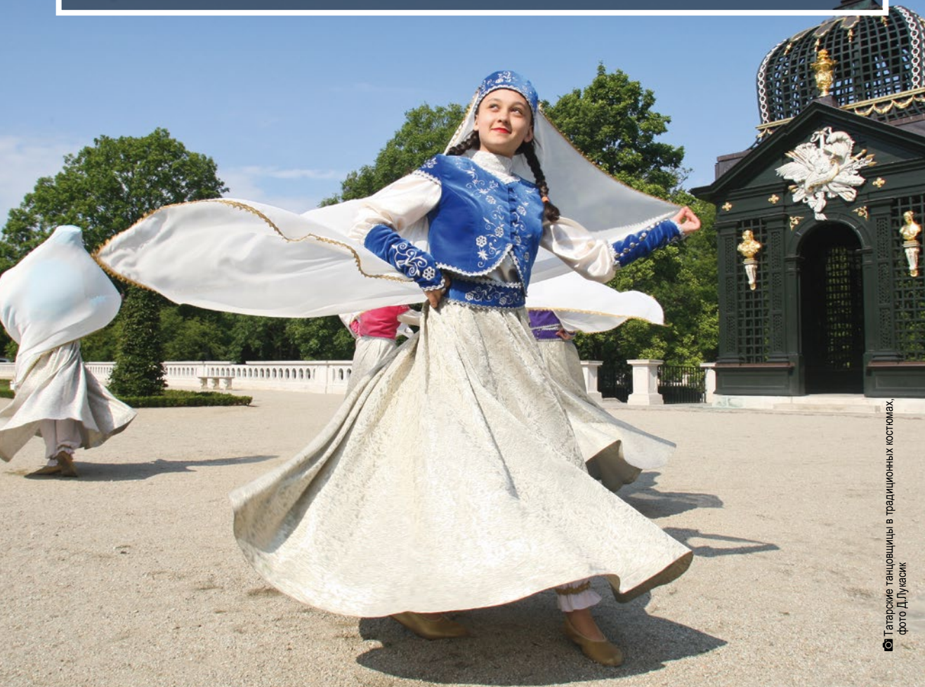
Татарские танцовщицы в традиционных костюмах

становятся разноцветной сценой, на которой звучат мелодии разных народов, жителей подляского воеводства а также самых отдалённых районов мира. Люди танцуют, учатся играть на народных инструментах, восхищаются яркими узорами традиционных национальных костюмов.