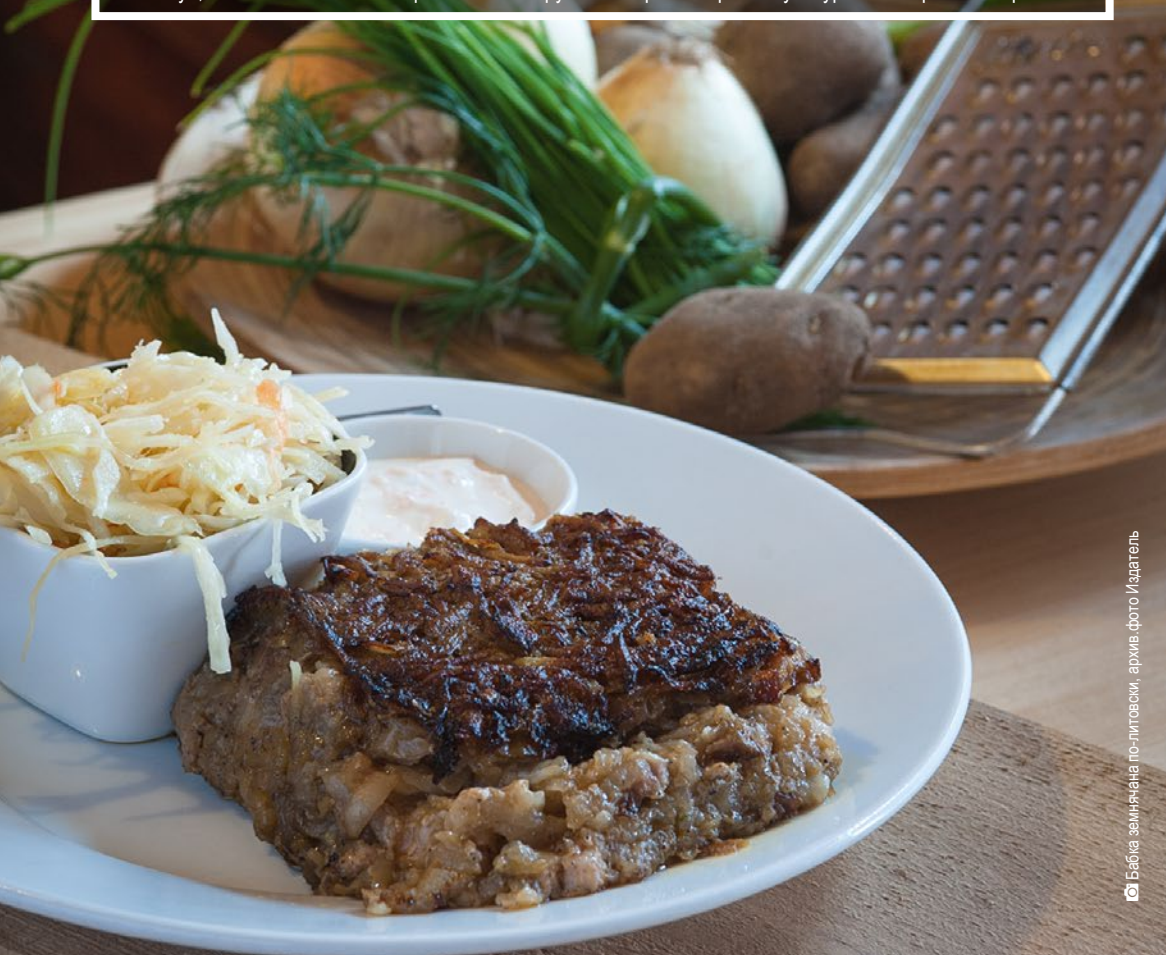
Бабка земнячана по-литовски, архив. фото Издатель

«Саскрыдис» и Фестиваль Музыки Молодой Беларуси «Басовица» – это такие, повторяющиеся ежегодно мероприятия, которые притягивают огромное количество заинтересованных. Эти фестивали, также как Подляская Октава Культур, прекрасно иллюстрируют разнообразие культур и гостеприимство региона.