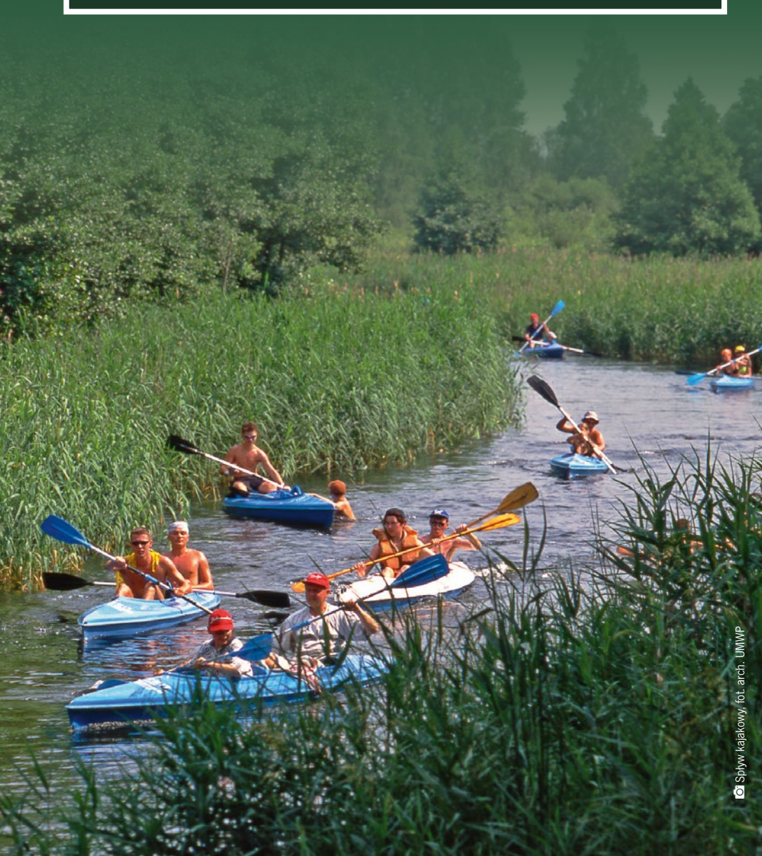
Spływ kajakowy

Liczne jeziora i malownicze rzeki sprzyjają turystom preferującym wypoczynek na wodzie. Spływy kajakowe Sokołdą czy Biebrzą pozwalają cieszyć się bliskością przyrody oraz podziwiać drewnianą architekturę podlaskich wsi. Z kolei nowoczesne wyciągi nart wodnych w Augustowie, Szelmencie czy Wasilkowie zachęcają do uprawiania sportów wodnych.